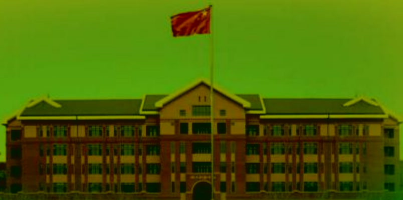
天津机电职业技术学院

TIANJIN VOCATIONAL COLLEGE OF MECHANICAL AND ELECTRICAL ENGINEERING